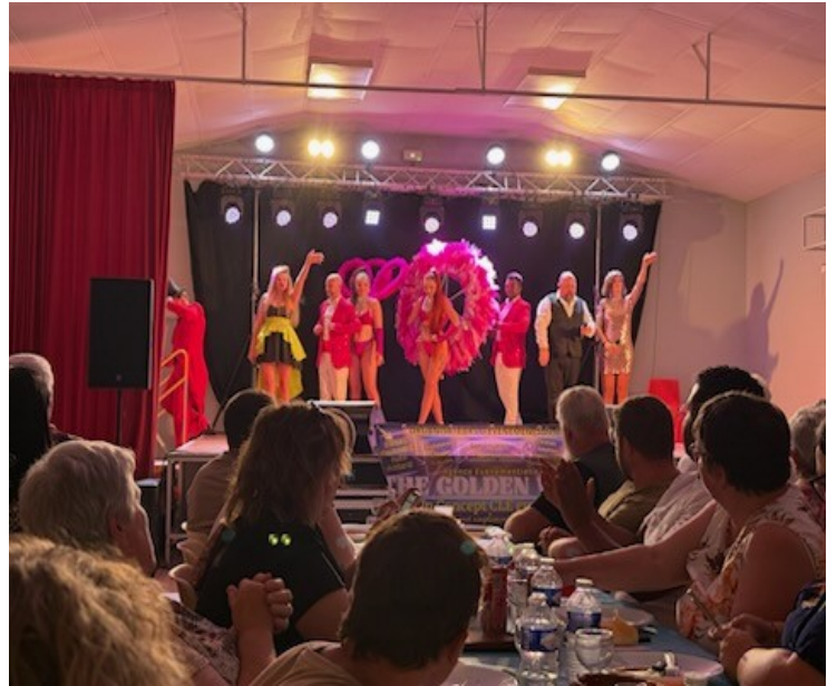
En Mai, La fête communale. En Juin, la fête de la musique