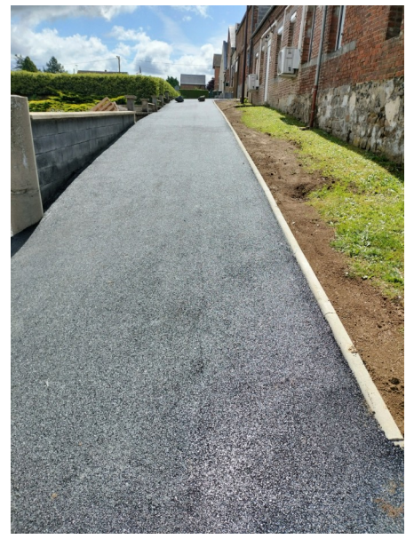
Travaux: La ruelle Bernard, la rue du MIDI, l'Impasse de la Mairie