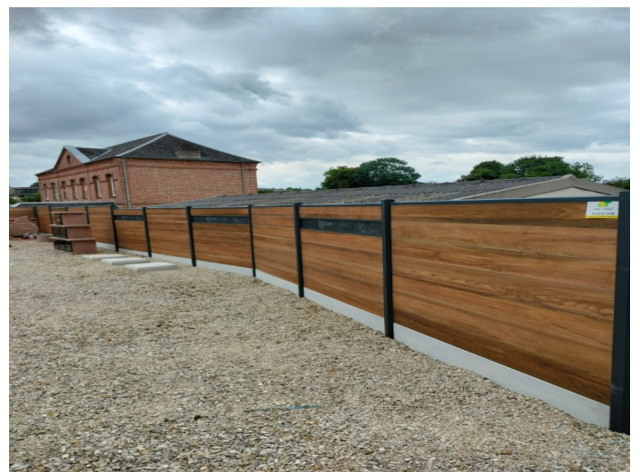
Cimetière, Brise vues Columbariums